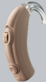
DaVinci PsP Estándar

Para pacientes que están en transición a la amplificación, el auricular suave del PsP abierto y el tubo miniatura evitan la sensación de "oído tapado" que muchos