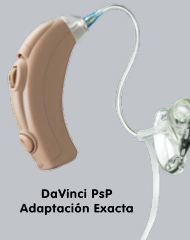
DaVinci PsP Adaptación Exacta

Para mejorar el entendimiento en todas las situaciones, DaVinci PsP estándar utiliza la exclusiva Imagen de Precisión Direccional (PDI) de Starkey. Este innovativo sistema de recepción de audio automáticamente reconoce sonidos y conversaciones frente suyo, mientras minimiza los sonidos menos importantes a los lados