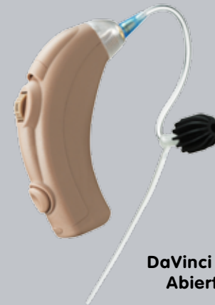
DaVinci PsP Abierto

DaVinci PsP estándar y PsP abierto, proporcionan una amplificación clara y digital del sistema operativo de Imagen de Precisión Auditiva (PAI) de Starkey. PAI ofrece manejo del ruido, cancelación de retroalimentación y tres memorias programables.